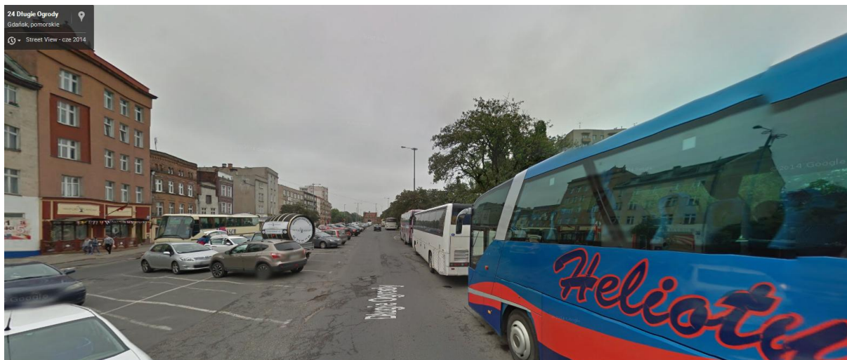
Parking przy ulicy Długie Ogrody (na wysokości szkoły ekonomiczno – handlowej)

2. Powrót i odbiór dzieci z kolonii dnia 29.07.2015 (środa)